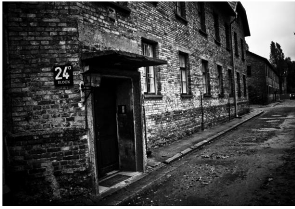
Punkt II wycieczki - muzeum w Oświęcimiu