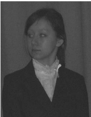
Nasza „Szefowa” w trakcie pracy