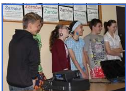
Drużyna druga, uśmiechnięci, widać, że dobrze im 'szło' xD