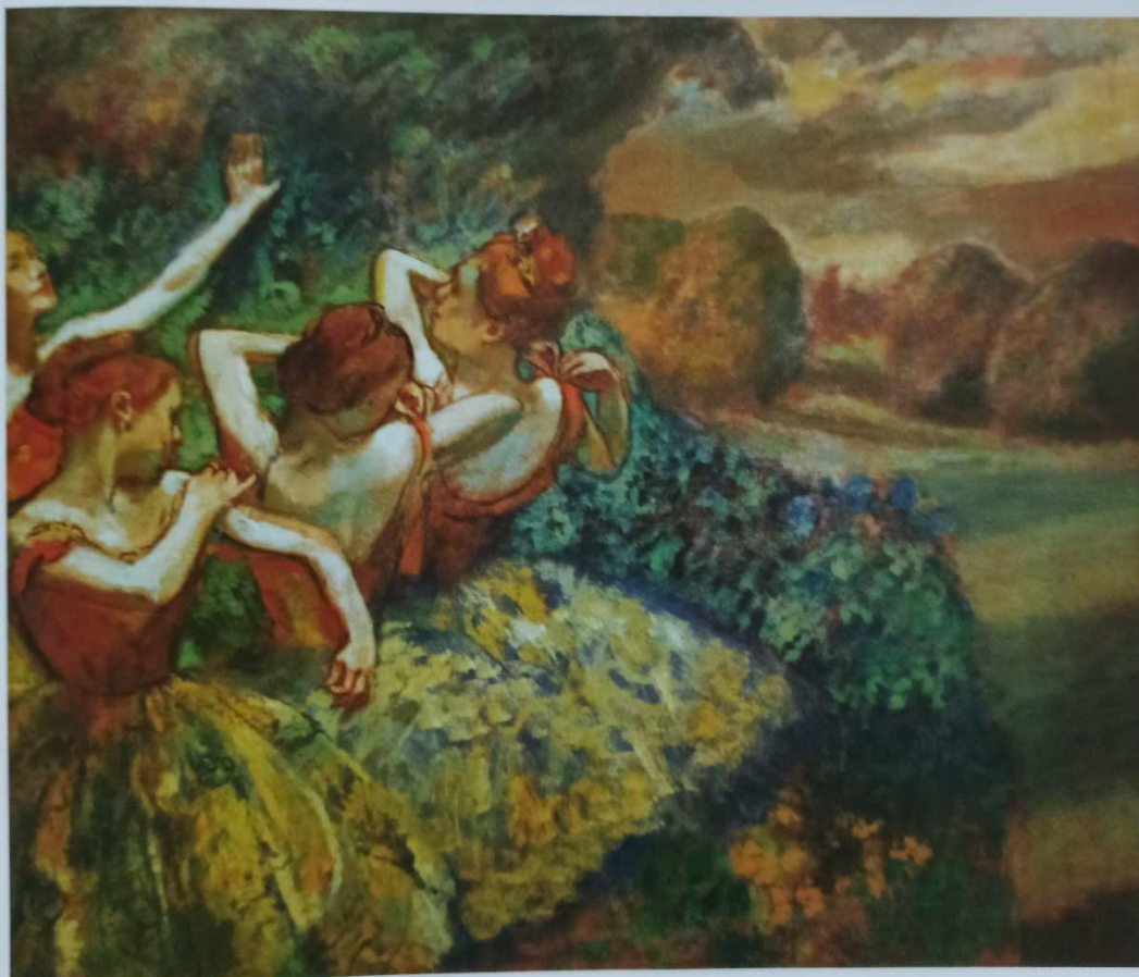
Edgar Degas, Cztery tancerki , 1899

Kolejną metodę tworzenia złudzenia głębi na płaskiej powierzchni obrazu nazywamy układem lub perspektywą kulisową . Tym razem wykorzystywane jest zjawisko nakładania się płaszczyzn. Co to znaczy? Pojęcie kulis wiąże się z teatrem. Dekoracja pokazana w całości tworzy plan pierwszy, następane plany widoczne są częściowo.